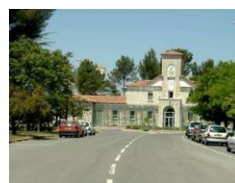
Bât. Horloge -SMA