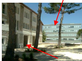
Bât. LAENNEC : esplanade passer sous les arcades