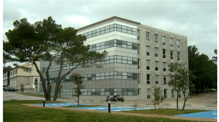
Bât Gérard Mégie (nom en contrebas)